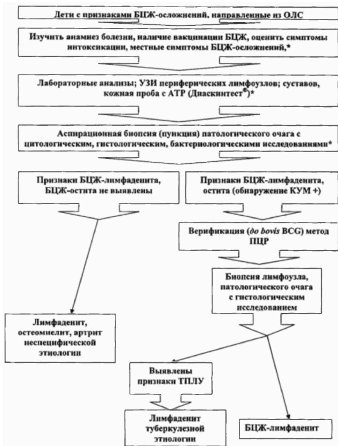
Схема 2. Алгоритм дифференциальной диагностики БЦЖ-осложнений у детей в условиях туберкулезного учреждения