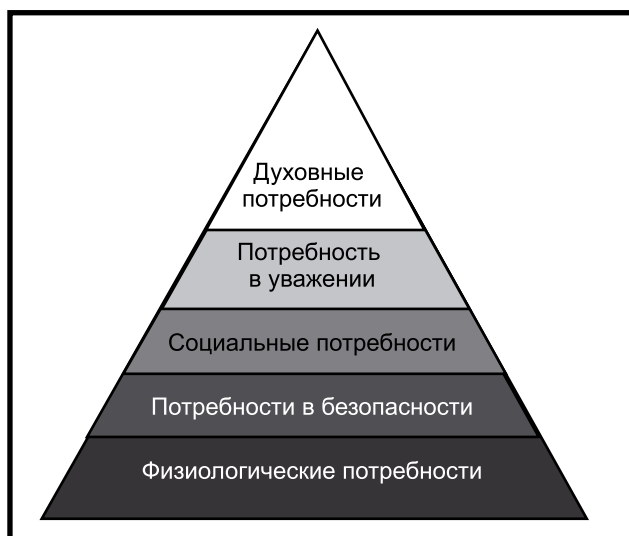
Рис. 1. Пирамида Маслоу (адаптировано) [2].

Прожиточный минимум — платежи и сборы. Величина прожиточного минимума на душу населения по трем основным социально-демографическим группам населения (лица трудоспособного возраста, пенсионеры и дети)