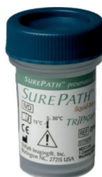
Рис. 4. Виала с транспортной средой для жидкостной цитологии.