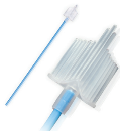
Рис. 2. Зонд урогенитальный тип F1.