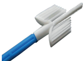
Рис. 1. Зонд урогенитальный тип F3.

Для хранения и транспортировки клеточного материала используют небольшие флаконы с герметичной крышкой и прокладкой — виалу (рис. 4)