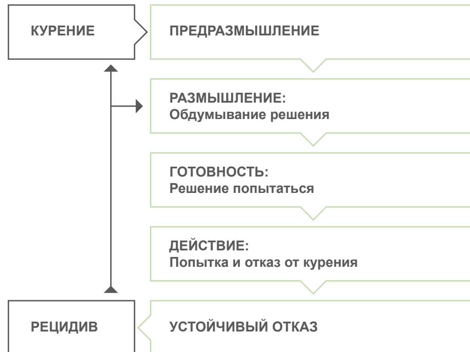
Рис. 2. Схема изменения поведения

Согласно этой модели, в каждый конкретный момент времени курильщики могут переживать одно из четырех состояний относительно решения отказа от курения. Они могут находиться в стадии действия, в стадии готовности, размышления или предразмышления.